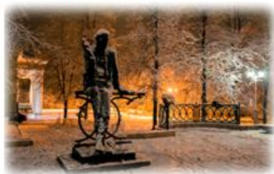
Памятник А. Решетову

Электронное пособие имеет аналоговый вариант в виде карманного QR-справочника, который используют с мобильным приложением «Сканер QR-кодов».