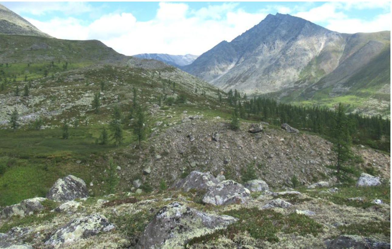
Ф. 2. Древний моренный вал перегораживает долину 2-го правого притока руч. Олений.