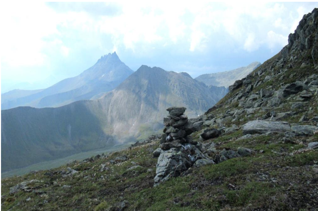
Ф. 8. Тур на пер. Красная Скала. На заднем плане: г. Манарага.