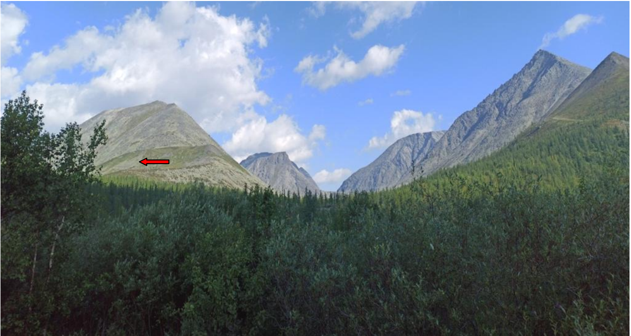
Ф. 1. Вид от р. Манарага вверх по долине руч. Олений: долина 2-го правого притока (←).