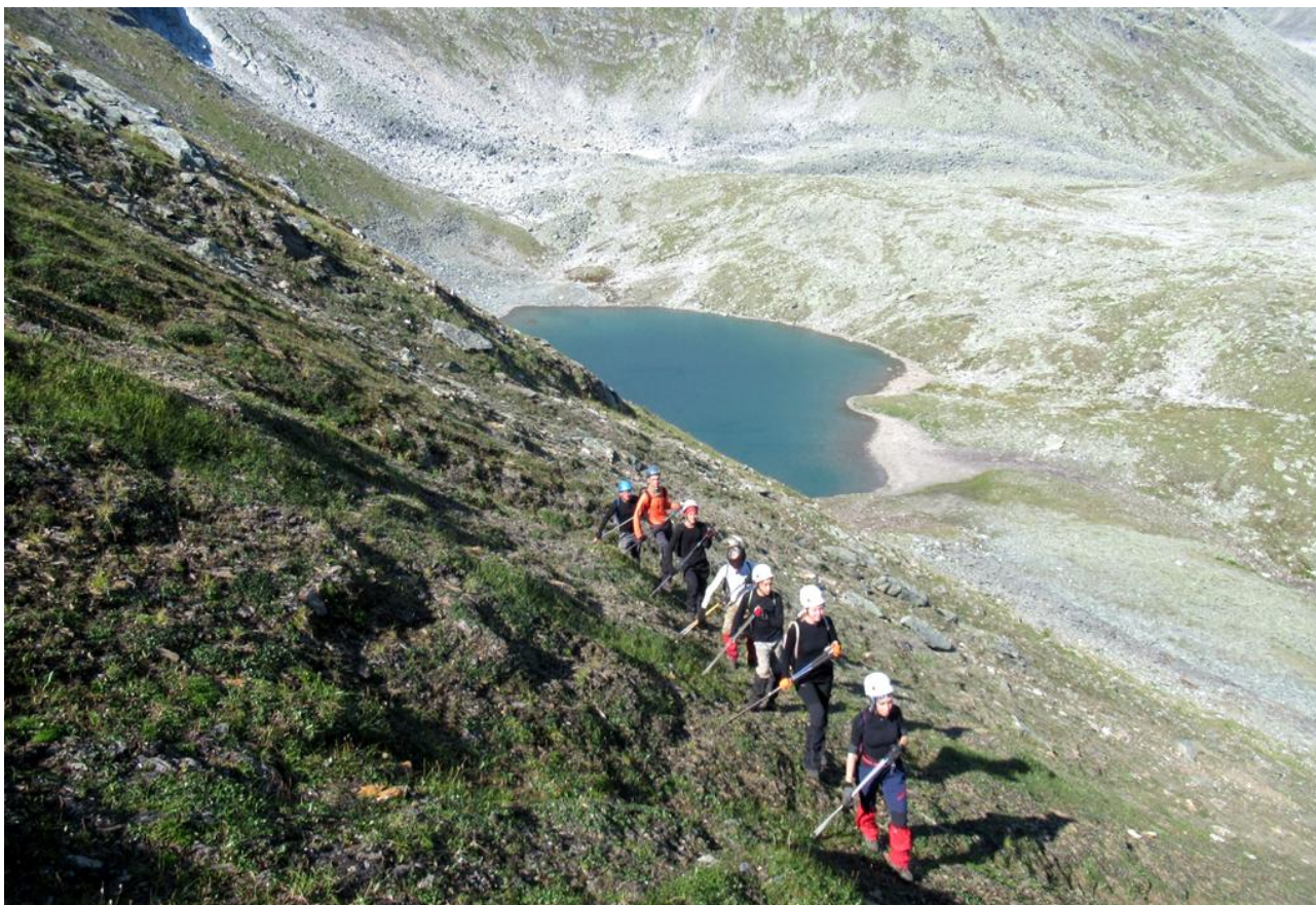
Ф. 5. Подъем от озера в истоке 2-го правого притока руч. Олений на пер. Красная Скала.