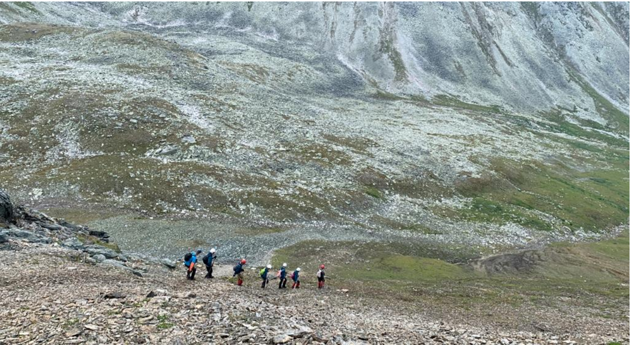
Ф. 11, 12. Спуск от тура на пер. Красная Скала в долину 2-го правого притока руч. Олений.