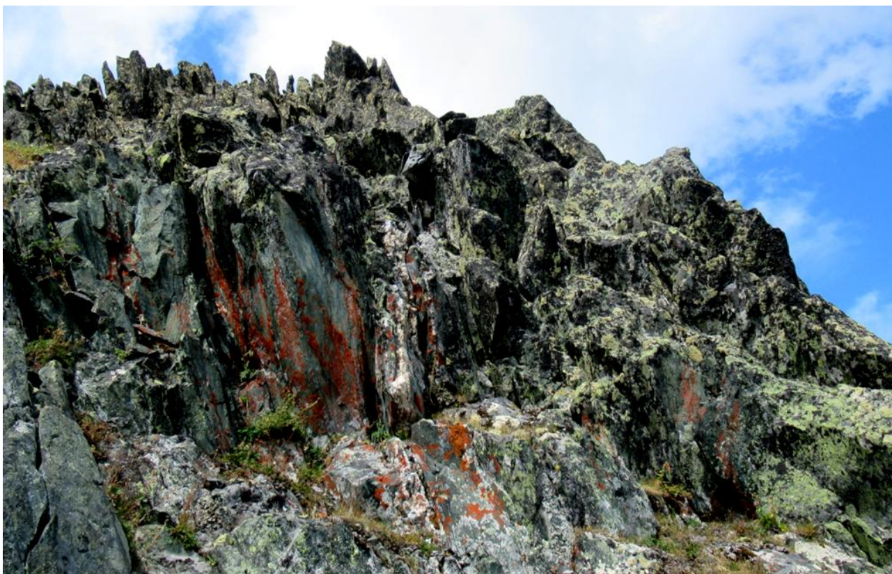
Ф. 9. Красные лишайники на скалах «дали» перевалу название – Красная Скала.