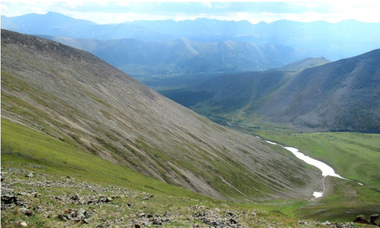
Ф. 10. Вид с седловины пер. Красная Скала на Ю. – в долину р. Манарага.