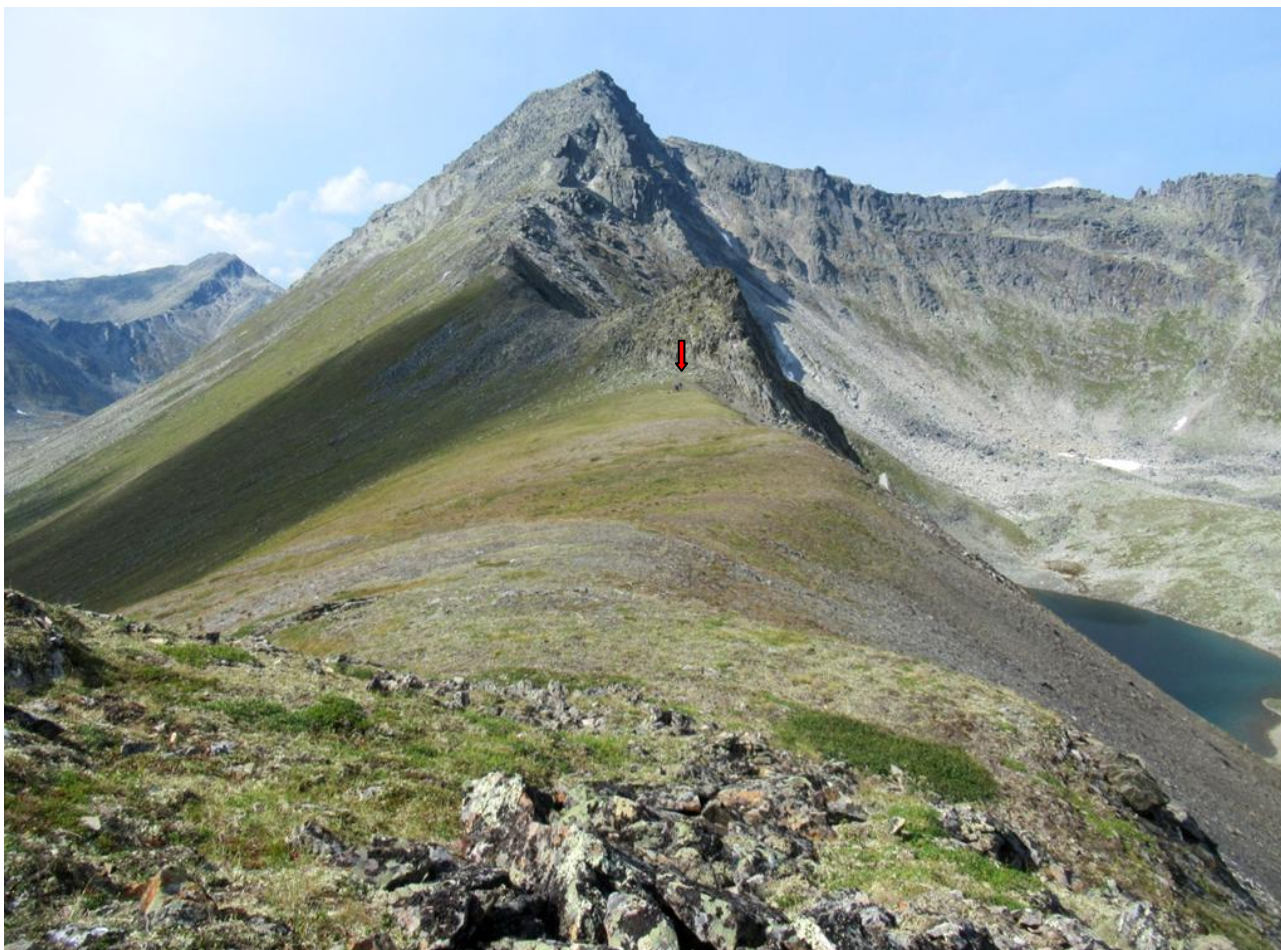
Ф. 7. Седловина пер. Красная Скала (вид на СЗ.). Тур сложен у подножия скалы (↓).