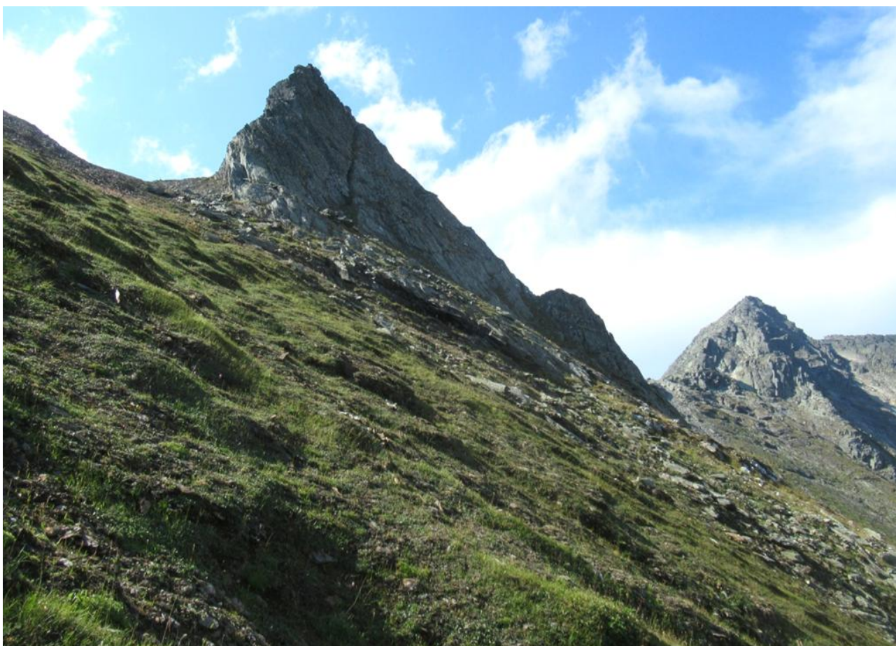
Ф. 6. Верхняя часть склона при подъеме на пер. Красная Скала из долины руч. Олений.