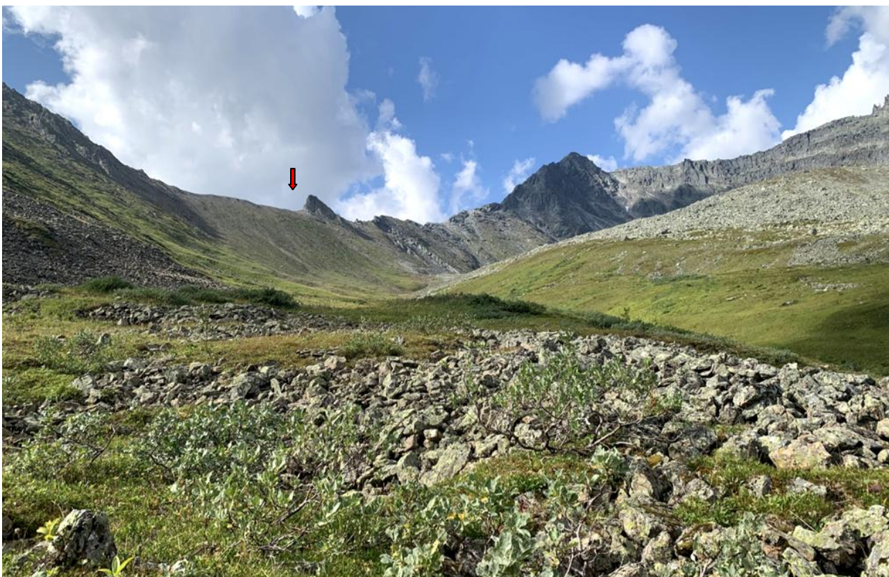
Ф. 4. Вид на верхнюю часть долины притока и пер. Красная Скала (↓). На заднем плане: г. Крузенитерна.